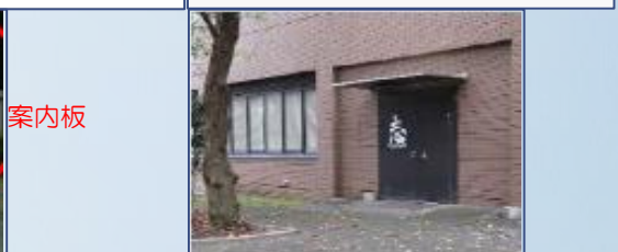
③右手「志」の文字が書いてあるドアが入口